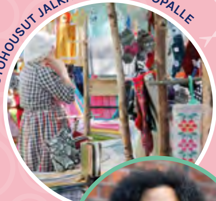
LUOVUUS KUKKII - TULE JA TEE