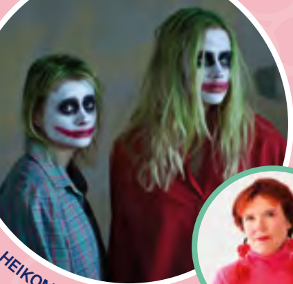
HEIKOMPAA JO HIRVITTÄÄ