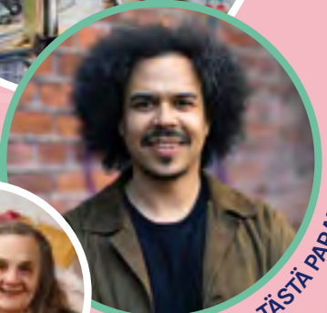
SUNKHAAN SE TÄSTÄ PARANE