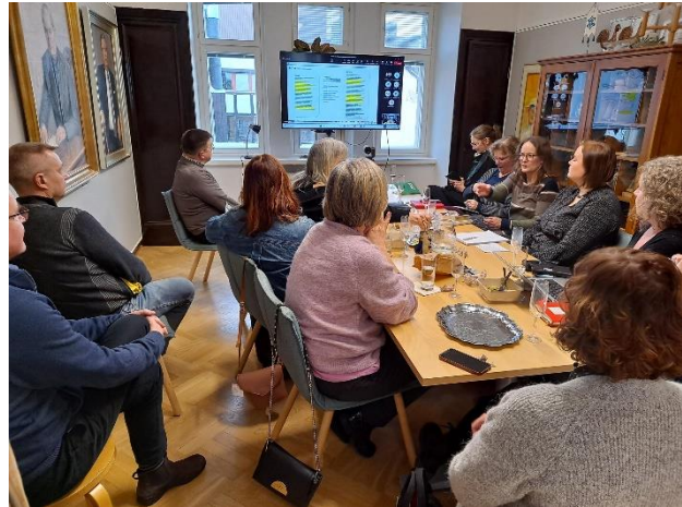
Maakuntien liittojen kulttuurivastaavat ja Taiken väki vierailulla Kotiseutuliiton toimistolla tammikuussa 2024.

Maakunnalliset kokoukset ovat vuosittainen verkostoitumis- ja koulutustilaisuus liiton jäsenille, luottamushenkilöille ja henkilökunnalle. Maakunnallisissa kokouksissa jäsenet pääsevät vaikuttamaan liiton ja koko kotiseutuliikkeen tulevaisuuden suuntaan.