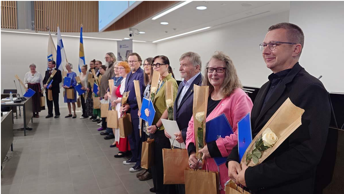
Suomen Kotiseutuliitolla on koko maan kattava organisaatio. Kuvassa vuonna 2024 valittujen Maakunnallisten kotiseututekojen edustajia Vantaalla.