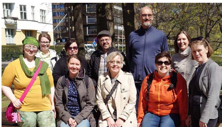
Kotiseutuliiton henkilökuntaa keväällä 2024.

Henkilökunta on nimennyt keskuudestaan toimiston luottamushenkilön ja työsuojeluvaltuutetun. Työnantaja on nimennyt työsuojelupäällikön.