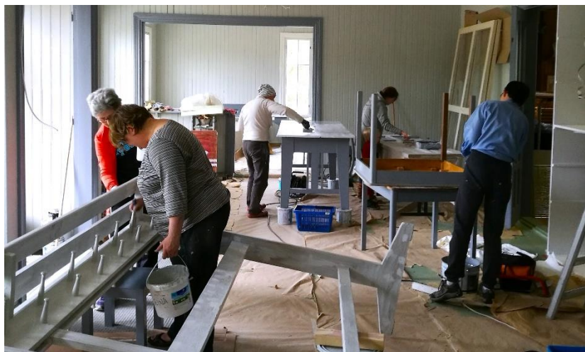
Huonekalujen maalaustalkoot Kerkkoon nuorisoseurantalolla.

Korjausavustusten hoitamiseksi ja korjausneuvonnalle on laadittu erillinen toimintasuunnitelma, jossa on määritelty työn yksityiskohteisemmat toimenpiteet vuodelle 2025. Toimintasuunnitelman hyväksyy seurantaloasiain neuvottelukunta.