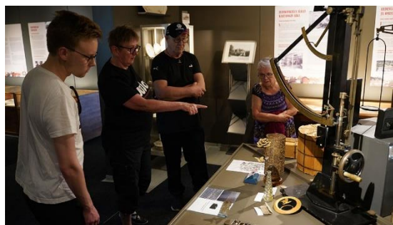
Juankosken Kulttuurihistoriallinen Seura ylläpitää Museo Brunouta, joka on Juankosken tehtaan ja työväen museo.

Vuonna 2025 jatkuu kesällä 2024 alkanut Paikallismuseoiden digitaalisten palveluiden ja toimintamallien kehittämishanke, ns. Digipamu-hanke, jonka rahoitus tulee OKM:n kulttuurin ja luovien alojen rakennetuesta.