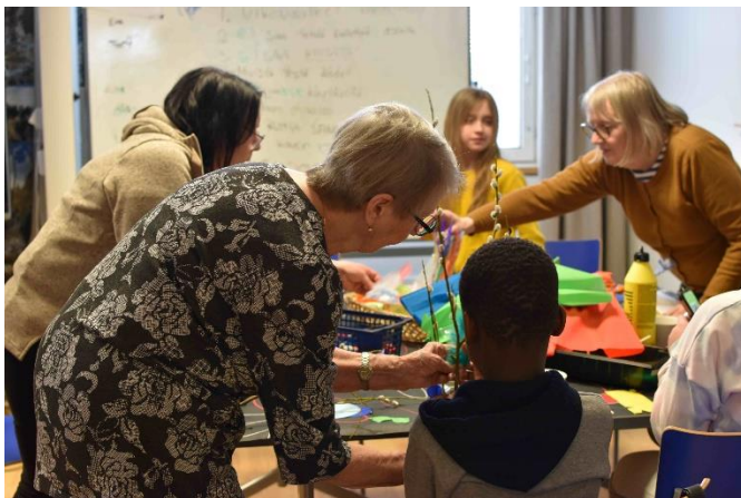
Mestarit & kisällit -toimintaa Vantaalla.