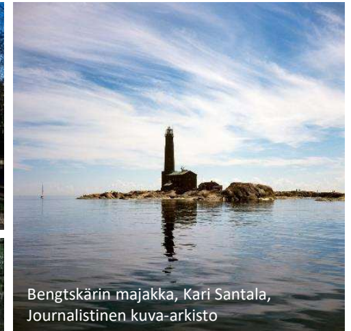
Bengtškärin majakka, Kari Santala, Journalistinen kuva-arkisto