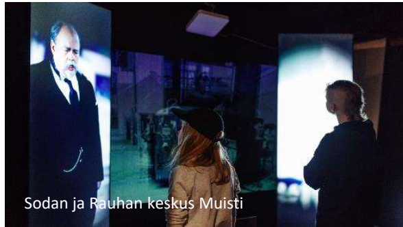
Sodan ja Rauhan keskus Muisti