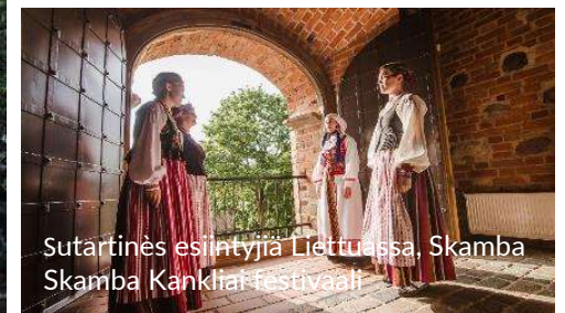
Sutartinės esintyjia Lietuvasa, Skamba Skamba Kankliai festivalai