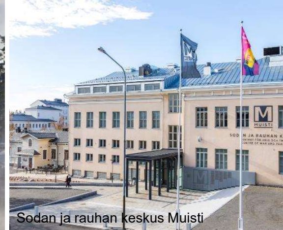
Sodan ja rauhan keskus Muisti