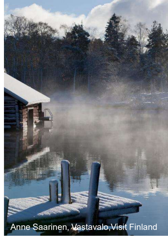
Anne Saarinen, Vastavalo, Visit Finland