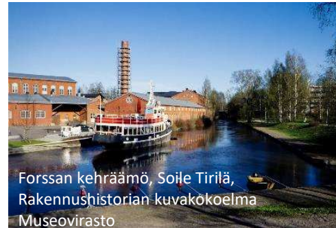
Forssan kehäämö