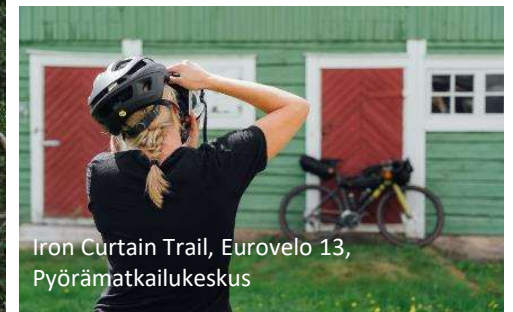
Iron Curtain Trail, Eurovelo 13, Pyörämatkailukeskus