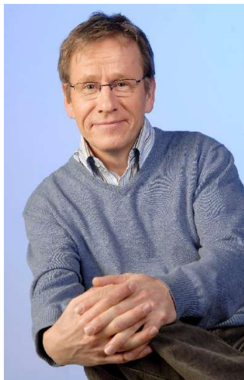
Vuoden kotiseututeoksen valitsi Yleisradion kirjallisuustoimittaja Seppo Puttonen.

Vuoden kotiseutuyhdistyksen valinnassa ei ollut varsinaista raatia, esikarsinnan suorittivat liiton toiminnanjohtaja, järjestöpäällikkö ja hallintosihteeri, minkä jälkeen liiton hallitus teki esityksen valtuustolle.