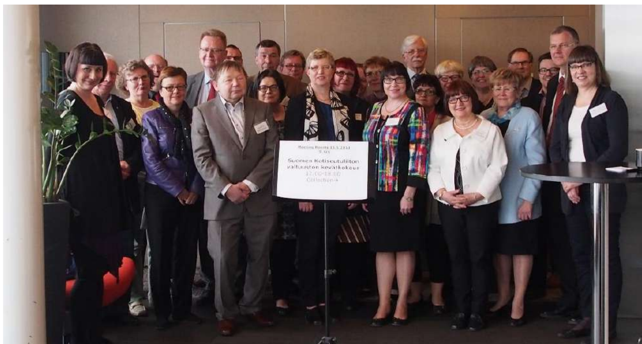
Valtuusto, hallitus ja henkilökuntaa Espoossa 16.5.2014.