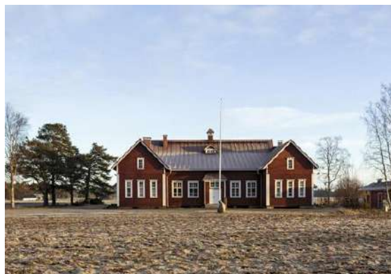
Hailuodon Nuorisoseuratalo.