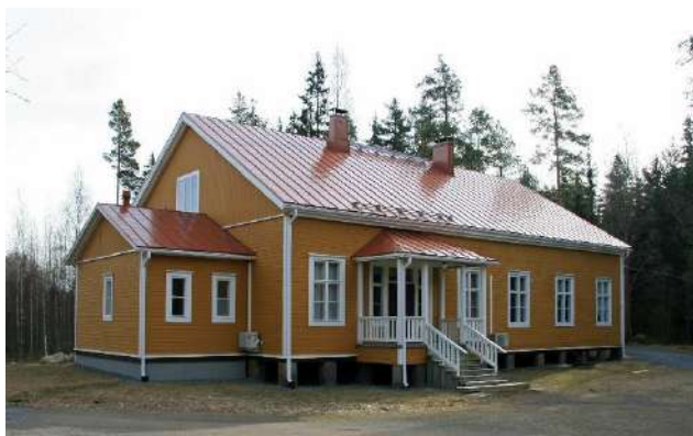
Nikkaroisten nuorisoseuratalo Papula.

Vuonna 2013 Hailuodon Nuorisoseuralle myönnetty Hyvän korjauksen palkinto luovutettiin 8.6.2014 talolla järjestetyssä juhlassa. Palkinnon luovutti Riitta Vanhatalo.