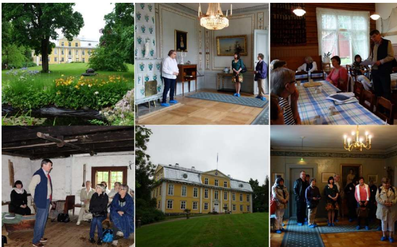
Klubiretki kesäkuussa läntisen Uudenmaan kulttuurikohteisiin oli onnistunut ja varsin sisältörikas.