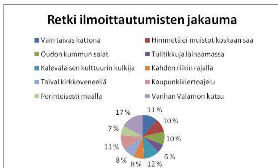
KUVIO 1 Retki-ilmoittautumisten jakauma

Mikäli Taival kirkkoveneellä –retkeä ei huomioida, eniten kotiseutupäiville osallistujia kiinnosti Vanhan Valamon kutsu –retki, jonne osallistui 17 % kaikista retkeläisistä. Toiseksi eniten ilmoittautumisia tuli Kalevalaisen kulttuurin kulkija –retkelle: 12 %. Vain taivas kattona ja Kaupunkikiertoajelu saivat molemmat 11 % osallistujista ja Himmetä ei muistot koskaan saa sekä Oudon kummun salat puolestaan 10 %. Kahden riikin rajalla ja Taival kirkkoveneellä –retkille osallistui 8 % ilmoittautuneista. Perinteisesti maalla –retken valitsi 7 % ja Tulitikkuja lainaamassa kävi 6 % osallistujista.