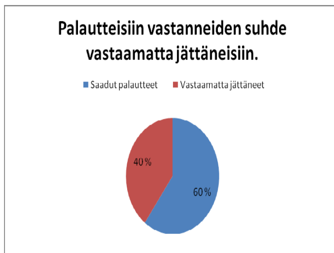
KUVIO 3 Palautteisiin vastanneiden suhde vastaamatta jättäneisiin

Kaikkiaan retkille osallistuneita oli 354 (lähde: Kongressi ohjelma). Heistä 60 % vastasi palautteeseen ja 40 % ei kokenut palautteen antamista tarpeelliseksi.